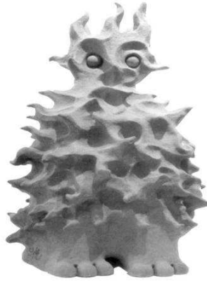
الشكل رقم (١)