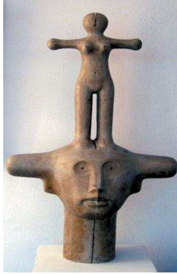
الشكل رقم (٢)